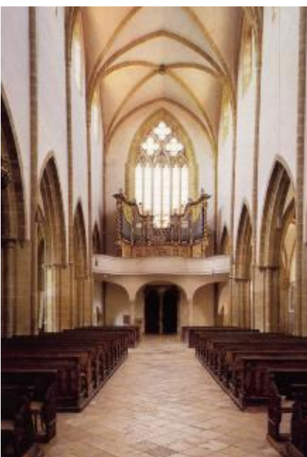
Blick zum Westfenster und zur Orgelempore (um 1727)