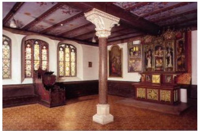
Albertus-Magnus-Kapelle mit Albertusaltar (1896) und Katheder (um 1475)