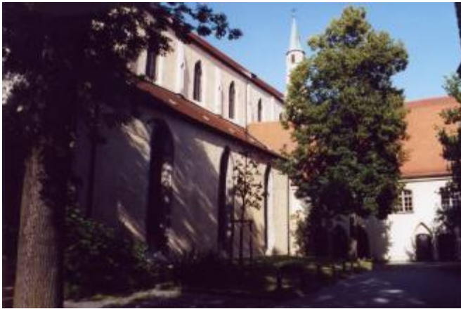
Ehemalige Dominikanerkirche St. Blasius mit Klostertrakt