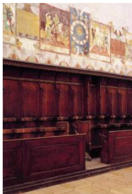
Chorgestühl mit Freskomalerei (Ende 15. Jh.)